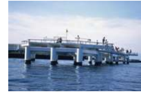
黒部市 フィッシャーマンズワーフ