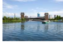
富山市 富岩運河環水公園