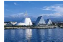
魚津市 海の駅 蟹気楼