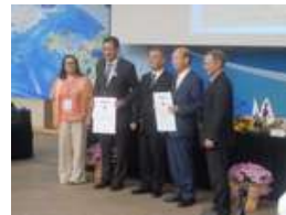
ギャリップ・ゲル理事長から石川県知事に加盟証書