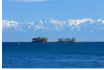
氷見市 蛇が島と立山連峰