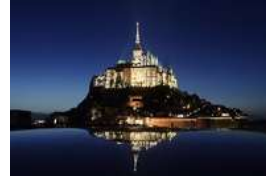
モンサンミッシェル湾