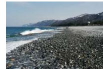
朝日町 ヒスイ海岸