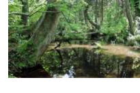
入善町 杉沢の沢スギ