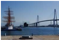
射水市 海王丸と新湊大橋