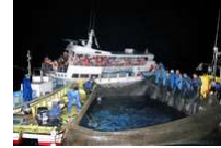
滑川市 ほたるいか観光